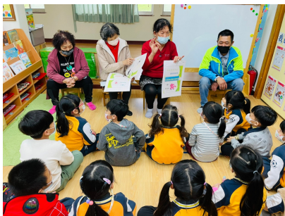
阿嬤台語故事分享