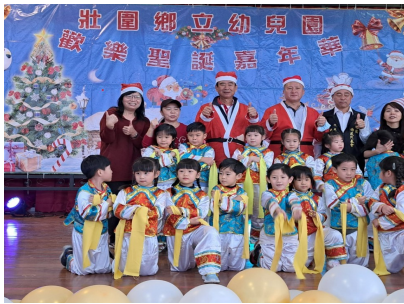
歡樂聖誕嘉年華活動